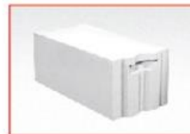
С системой паз-гребень