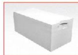
С захватами для рук